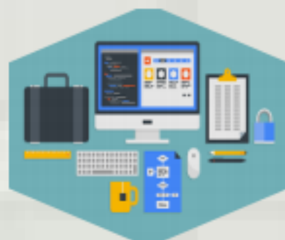
Desarrollo de Software