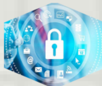
Seguridad de la Información